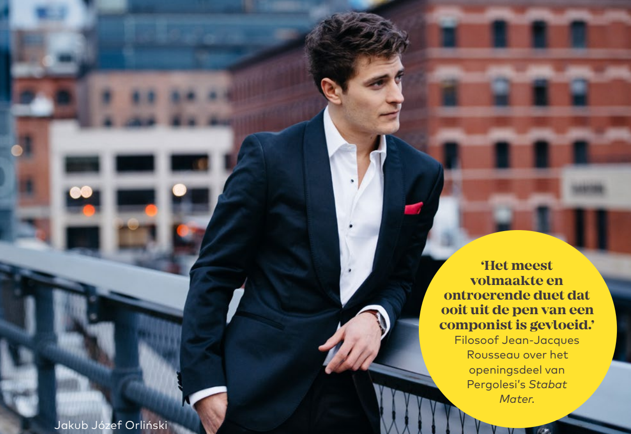
Jakub Józef Orliński

'Het meest volmaakte en ontroerende duet dat ooit uit de pen van een componist is gevloeid.'