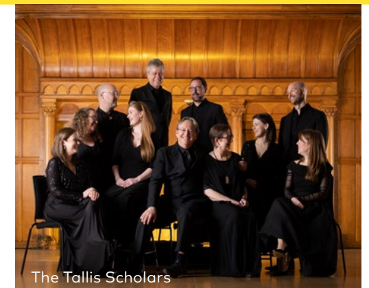
The Tallis Scholars

The Tallis Scholars hebben zich in meer dan vijf decennia gevestigd als toonaangevend ensemble voor vocale muziek uit de renaissance. De zuiverheid, helderheid en puurheid van hun klank, gesteund door de rijke Engelse koortraditie, heeft hen beroemd en geliefd gemaakt. Die klank is met name gebaseerd op de eisen die de muziek van een componist als Palestrina stelt. Rond zijn