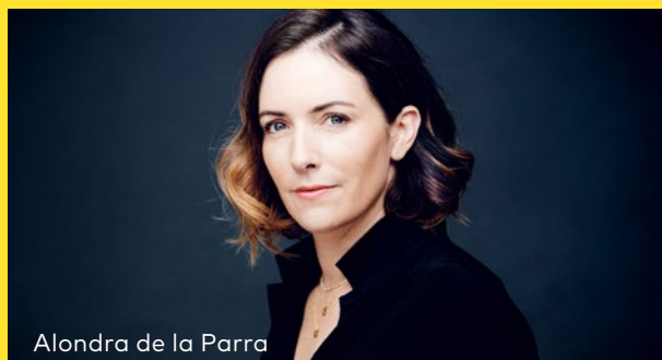
Alondra de la Parra

Gabriella Smith Tumblebird Contrails (NP) Gabriela Ortiz La Reina Roja voor orkest (NP, opdrachtwerk van Het Concertgebouw) Xenakis Rebonds B Revueltas La noche de los mayas (orkestsuite)